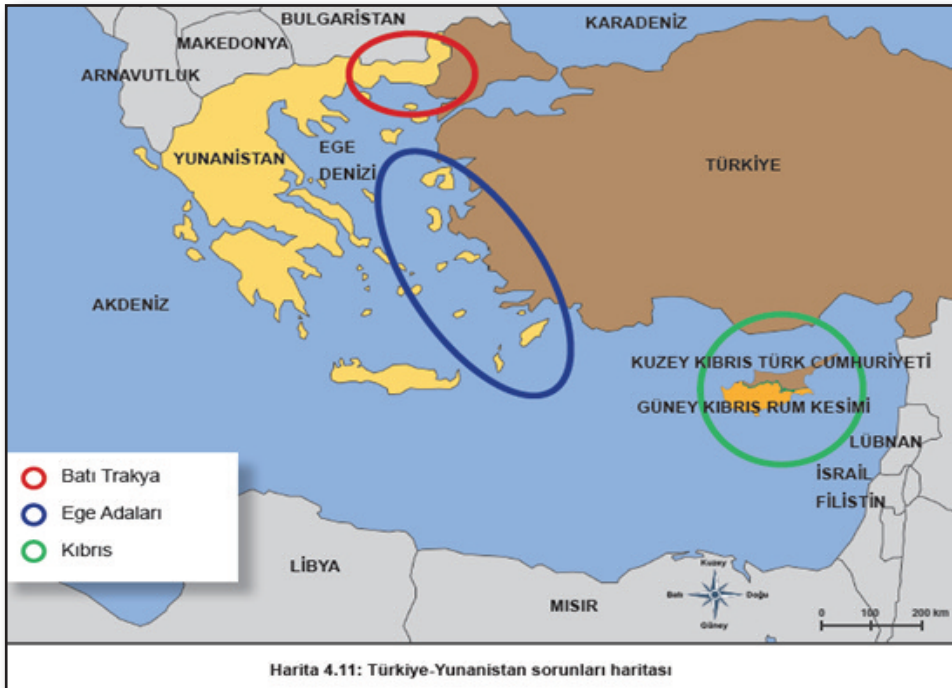
Εικόνα 1: Χάρτης των ελληνοτουρκικών προβλημάτων