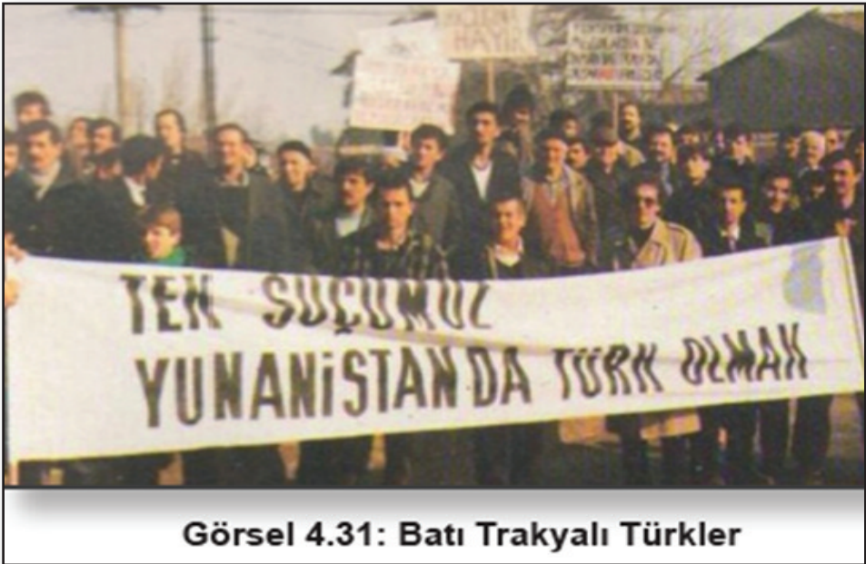
Görsel 4.31: Batı Trakyalı Türkler