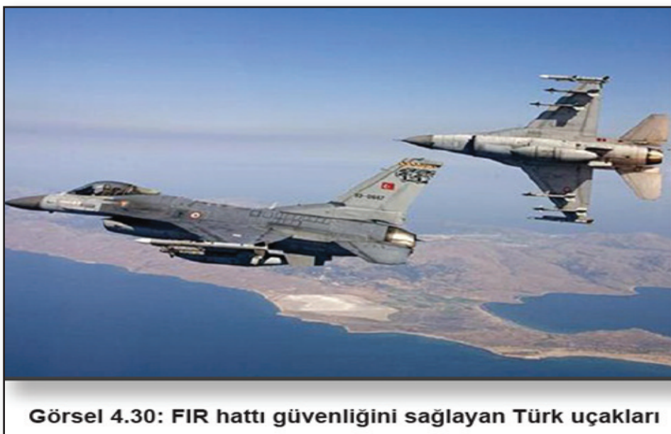
Görsel 4.30: FIR hattı güvenliğini sağlayan Türk uçakları

Και πάλι το τουρκικό εγχειρίδιο μεταβιβάζει την ευθύνη για το πρόβλημα αυτό στην Ελλάδα. Πιο συγκεκριμένα, το βιβλίο αναφέρει ότι πραγματοποιήθηκε «συνάντηση της ICAO (Διεθνής Οργανισμός Πολιτικής Αεροπορίας) στην Κωνσταντινούπολη, και αποφασίστηκε να ανατεθεί η ευθύνη για τη FIR (Flight Information Region - Περιοχή Πληροφοριών Πτήσεων) του Αιγαίου στην Ελλάδα» 7 . Όμως, σύμφωνα με το εγχειρίδιο «με την πάροδο του χρόνου, η Αθήνα άρχισε να θεωρεί τη FIR ως μια μορφή εναέριας κυριαρχίας και να την παρουσιάζει