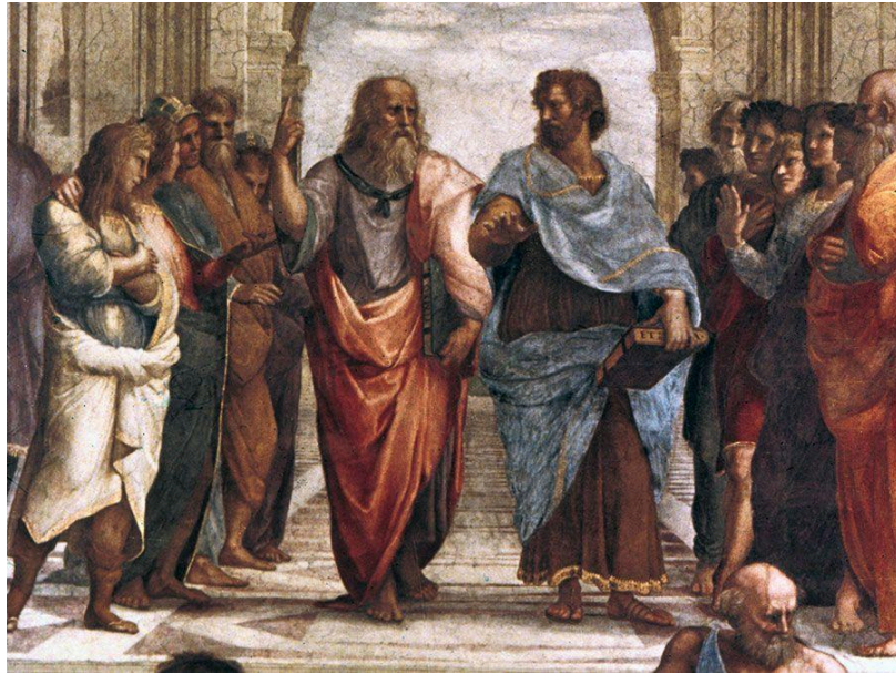
Σχήμα 2: "Η Σχολή των Αθηνών" του Ραφαήλ. Στο κέντρο απεικονίζονται ο Πλάτωνας (αριστερά) και ο Αριστοτέλης (δεξιά), εκπροσωπώντας διαφορετικές φιλοσοφικές προσεγγίσεις. Το έργο αποτελεί αλληγορία της φιλοσοφικής σκέψης και της γνώσης. (Britannica, 2024)