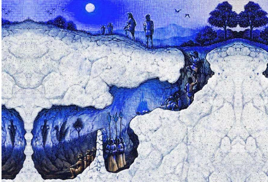
Σχήμα 3: Η Αλληγορία του Σπηλαίου από τον Πλάτωνα, όπως απεικονίζεται στην τέχνη (Lectures Bureau. (n.d.). Plato Analysis - Part I ).

μια φωτιά, συμβολίζοντας την παραπλανητική πραγματικότητα. Ένας κρατούμενος απελευθερώνεται, ανακαλύπτει τον πραγματικό κόσμο και επιστρέφει για να ενημερώσει τους άλλους (Press, 2007).